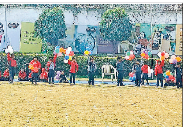
सोनीपत। प्रतियोगिता के दौरान खेलते बच्चे।

संदर्भ में कही गई है, न कि संपूर्ण नारी जाति के लिए। उन्होंने बढ़ती कन्या भ्रूण हत्या पर चिंता जताते हुए बताया कि कई परिवार बेटी की सुरक्षा को लेकर डरते हैं, लेकिन यह