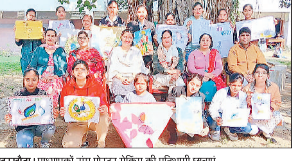
खरखौदा। प्राध्यापकों संग पोस्टर मेकिंग की प्रतिभागी छात्राएं