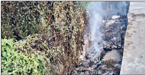
सोनीपत। सोनीपत के गांव राई स्थित औद्योगिक क्षेत्र के पास कूड़े में लगाई आग से उड़ता धुआं।