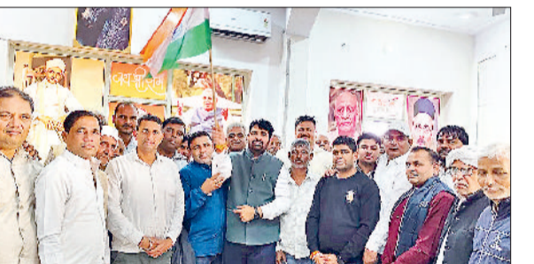
खरखौदा। यात्रा पर जाने वालों को हरी झंडी दिखाकर रवाना करते विधायक।