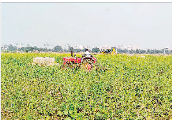
सोनीपत। खड़ी फसल में ट्रैक्टर चलाते हुए व मौके पर मौजूद पुलिस कर्मी साथ में अधिकारीगण व जेसीबी के साथ कार्रवाई करते हुए।

दीवारें और रैंप हटाए जाने के बाद रास्ते पहले से कहीं अधिक खुले और सुगम हो गए