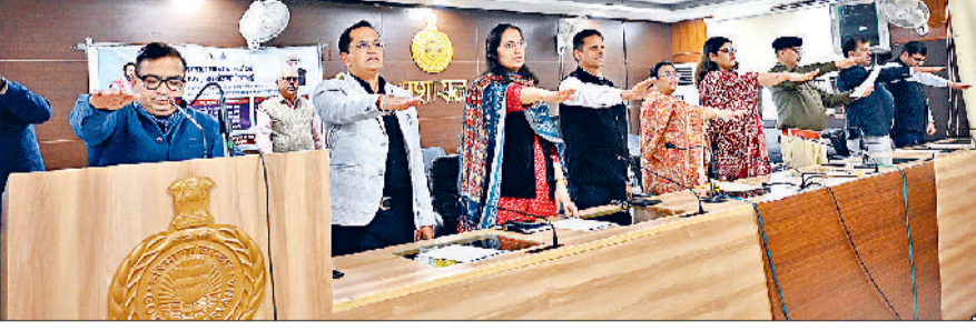
सोनीपत। नशे के खिलाफ शपथ लेते अधिकारी।