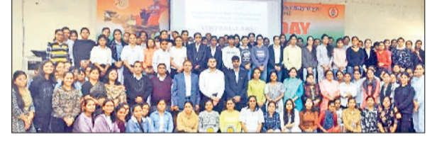
गोहाना। कार्यशाला में प्रतिभागी छात्रों के साथ आयोजक व वक्ता।

प्रति रुचि बढ़ाना और उनके ज्ञान की परीक्षा लेना था। प्रतियोगिता में विद्यार्थियों को विभिन्न प्रकार के प्रश्न पूछे गए, जिनमें इतिहास, भूगोल, राजनीति विज्ञान और अर्थशास्त्र से संबंधित प्रश्न शामिल थे।