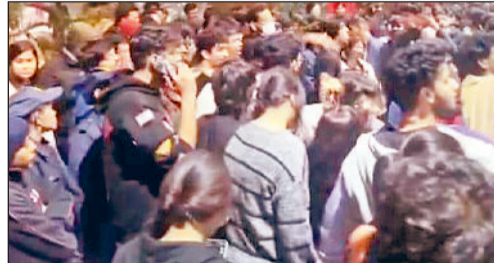
सोनीपत। ओपी जंदल विवि में विरोध प्रदर्शन करते हुए विद्यार्थी।