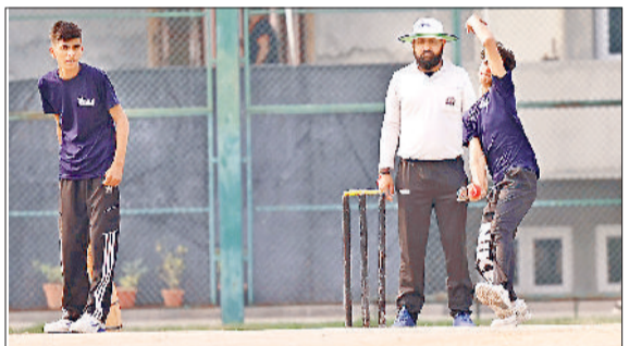
गनौर। टेनिस बाल क्रिकेट लीग के ट्रायल में बालिंग करते खिलाड़ी।

सोनीपत। सरस्वती शिक्षा संस्थान सोनियर सेक्टरडी स्कूल में मंगलवार को (प्री-प्राइमरी) कक्षा के नव-नवने बच्चों के लिए रेस प्रतियोगिताओं का उत्साहपूर्ण आयोजन किया। कार्यक्रम का मुख्य उद्देश्य छोटे बच्चों में खेल भावना का विकास, शारीरिक सक्रियता को बढ़ावा देना तथा आत्मविश्वास को प्रोत्साहित करना था। कार्यक्रम की शुरुआत शिक्षकों द्वारा बच्चों को रेस के नियम समझाने और एक छोटे वर्म-अप स्त्र से की गई। इसके बाद बच्चों ने बलून रेस, 50 मीटर रेस, बोरी रेस, लेमन-एंड-स्पून रेस जैसी रोचक प्रतियोगिताओं में बड़ी उत्सुकता से भाग लिया। अंत में उत्कृष्ट प्रदर्शन करने वाले बच्चों को मेडल और प्रशस्ति पत्र देकर सम्मानित किया गया।