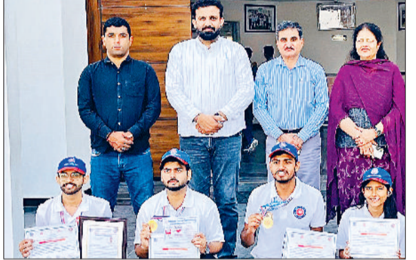
खरखौदा। प्राध्यापकों संग पोस्टर मेकिंग की प्रतिभागी छात्राएं