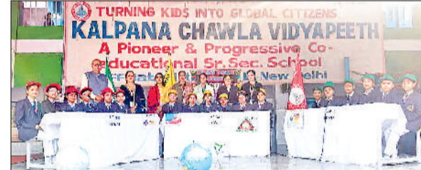
18 केकेडी 2 फोटो। प्रश्नोत्तरी प्रतियोगिता में भाग लेते विद्यार्थी