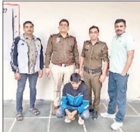
सोनीपत। गिरफ्तार आरोपित के साथ पुलिस टीम।

■ अदालत में पेश कर लिया रिमांड पर, दूसरा आरोपित नाबालिग, अभी गिरफ्तार से बाहर